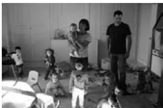
La salle d'activités