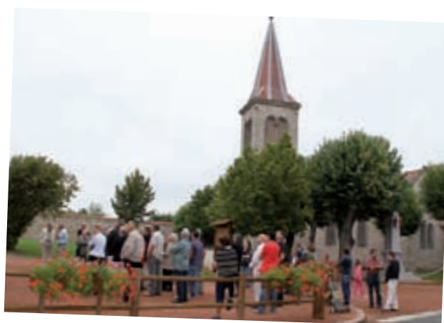
le 17 septembre dernier, le bâtiment de St Martin de Boisy a été inauguré.