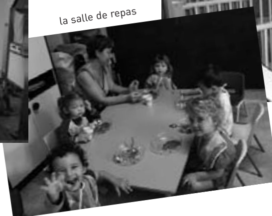
la salle de repas