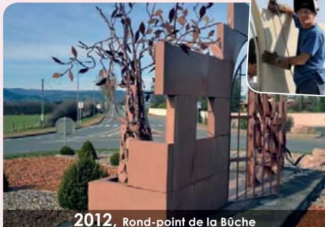
2012 , Rond-point de la Bûche