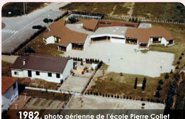
1982 , photo aérienne de l'école Pierre Collet

1982 , photo aérienne de l'école Pierre Collet Inaugurée le 10 novembre 1979, l'école "Pierre Collet" accueille 4 classes de primaire. Aujourd'hui elle en compte 7.