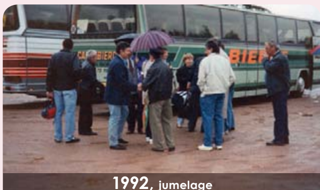
1992 , jumelage

Après quelques rapprochements pendant l'année 1991, le jumelage prend tournure et le 1 er échange se déroule le 19 juin 1992. A cette période, il était nécessaire de louer 2 cars pour transporter tous les participants à Montgivray.