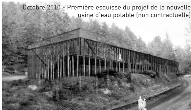
Octobre 2010 - Première esquisse du projet de la nouvelle usine d'eau potable (non contractuelle)

Pour plus de renseignements, contactez le service communication de Roannaise de l'Eau : communication@roannaise-de-leau.fr ou Roannaise de l'Eau Service Communication 63 rue Jean Jaurès - BP 30215 6 42313 ROANNE Cedex