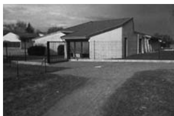
Chemin derrière l'école