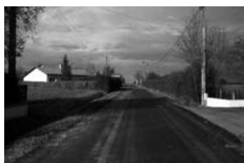
Route de la Bûche

■ La commission voirie a fait le bilan des travaux réalisés en 2010 sur la commune :