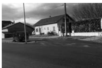
Délaissé RD 18